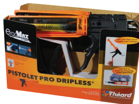
Produit dans son packaging