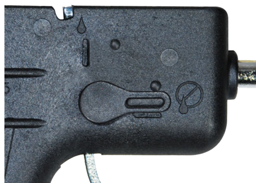
2 débits possibles